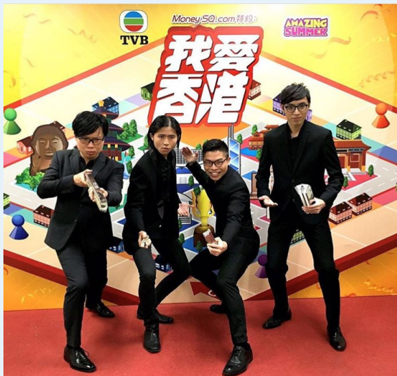
VELOZ 於電視廣播有限公司的攝製節目表演