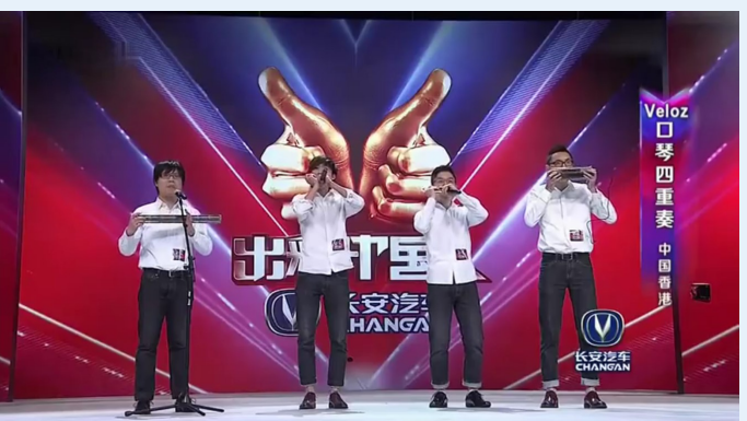
VELOZ 參加內地節目《出彩中國人》